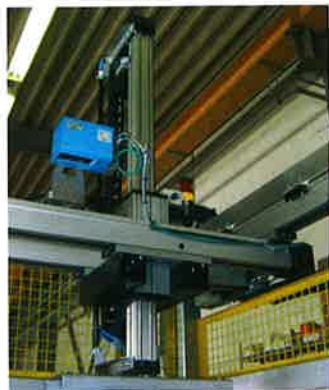
El sistema de Sick permite conocer la altura del ganado vacuno sin contacto con el animal.

Crossmuller Pty Ltd., especialista en soluciones tecnológicas para el sector industrial australiano, recibió el encargo de trabajar con el Beef CRC, centro creado para identificar los factores genéticos y no genéticos que afectan a la calidad de la carne y otras características de la producción de importancia económica. Su misión: crear una solución para facilitar la medición y almacenamiento de la altura de los animales. Para ello, contó con la ayuda de Sick Australia, que desarrolló un sistema de medición en tiempo real que utiliza la tecnología láser 3D. El sistema proporciona mediciones inmediatas sin contacto de la altura del ganado vacuno para predecir su rendimiento y optimizar su alimentación y gestión.