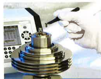
La nueva marca cuenta con patrones de precisión, de transferencia, de laboratorio y de industria.

Wika, proveedor de soluciones completas para la medida de presión y temperatura, ha adquirido recientemente la compañía DH-Budenberg, cuya gama incluye patrones de elevada precisión y patrones de transferencia de la marca Desgrange & Huot, así como patrones de laboratorio y de industria de la marca Budenberg.