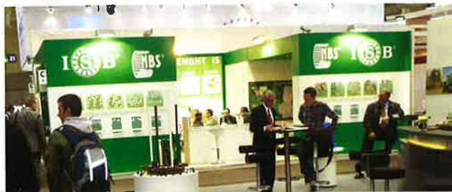
Stand de ISB en la feria de Hannover 2011

La marca ISB, comercializada en España por Euro Bearings, presentó en la reciente edición de la feria de Hannover 2011 como primicia mundial sus nuevos catálogos técnicos de rodamientos y componentes. La compañía participó en el salón, celebrado entre el 4 y el 8 de abril, tras su proceso de unificación de marca llevado a cabo en el transcurso de los últimos meses. Ahora ya se encuentran bajo su logotipo, no sólo los rodamientos de bolas o de motor eléctrico, sino también las gamas completas de soportes, rótulas y casquillos.